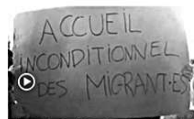
Fr3 Occitanie 18/03/23

Soyons le Savès antifasciste ! contact : saves_antifa@protonmail.com