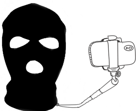
La cagoule avec perche à selfie intégrée : très pratique pour poster des photos sur les réseaux en direct du bloc

utilisée pour faire vendre en vidant la forme du fond. Cagoules et k-way noirs sont juste une esthétique et non pas des outils au service de l'anonymat collectif. La lutte se transforme en folklores, en modes, qu'on peut vendre ou acheter pour sentir le frisson de la révolte.