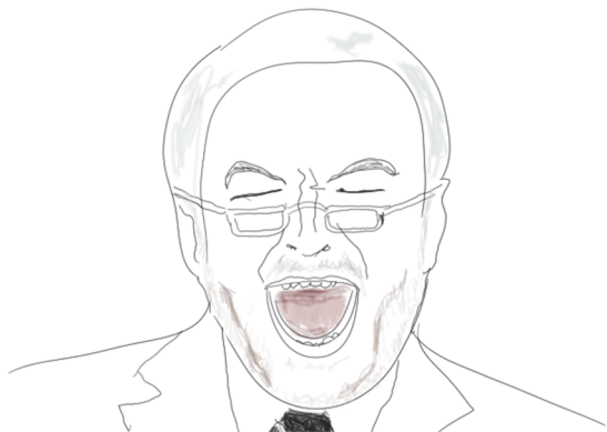
Un journaliste d'extrême-droite qui se dit anar – Trop des barres !

Tout au long de cette brochure, le terme « libéral » désignera « ce qui découle du libéralisme » (et par extension du néo-libéralisme) pour identifier les dérives libérales du milieu militant. Nous entendrons par là des discours et des pratiques qui, s'ils semblent en adéquation avec la théorie anarchiste, sont en réalité plutôt inspiré du libéralisme économique donc d'une certaine forme d'individualisme libéral, de la défense de la propriété privée, de la marchandisation du monde, de la concurrence et de la valeur travail. Nous avons repéré 3 dérives principales qui se retrouvent dans tous les mouvements révolutionnaires mais qui semble particulièrement dangereuses lorsqu'elles touchent les anarchistes.